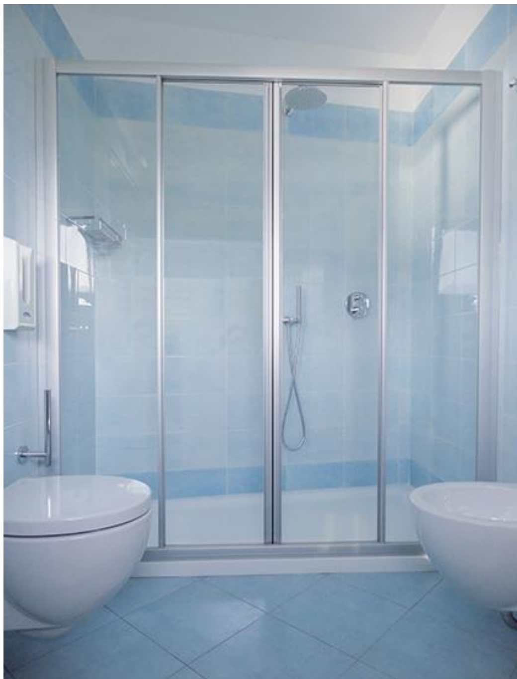
Schema di apertura